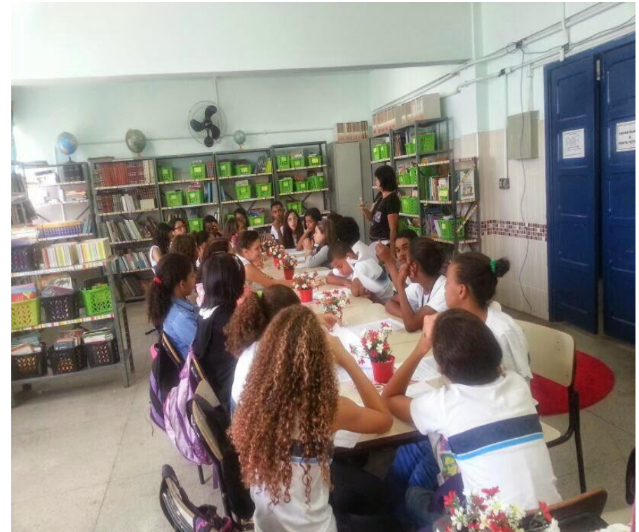
Roda de leitura na EM Guanabara - RJ